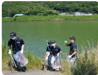
びわ湖の日 美化活動 Beautification activity on Lake biwa day