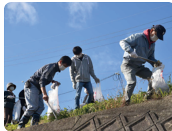
善光寺川清掃活動 Cleaning along the Zenkoji river

地域密着型の工場として、竜王町の次世代教育への貢献や、県・地域の美化活動に積極的に参加しています。