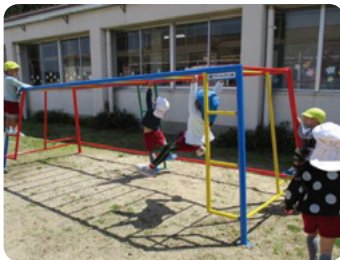
竜王町教育委員会への寄贈 Donation to the Ryuo town board of education