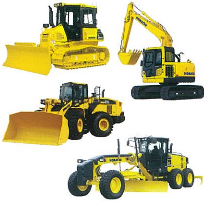
栗津工場 Awazu Plant