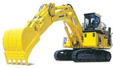
六甲工場 Rokko Plant