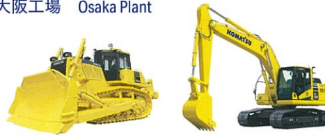
大阪工場 Osaka Plant