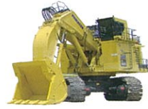
金沢工場 Kanazawa Plant