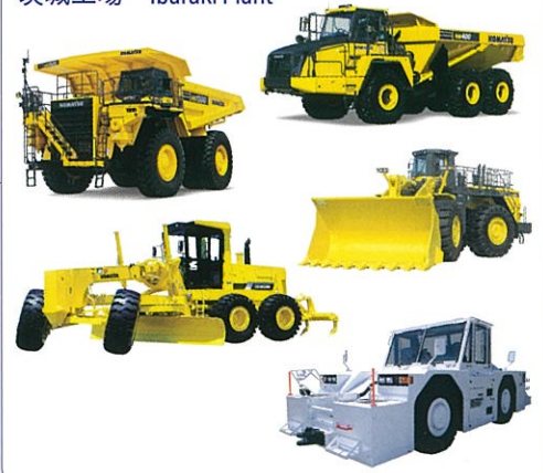
茨城工場 Ibaraki Plant